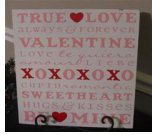
Word Collage Boards