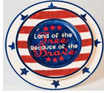
Land of the Free Plate