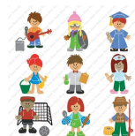
Cricut® Everyday Paper Dolls Cartridge