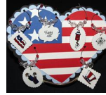
Fourth of July Glass Charms